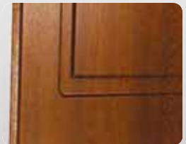
Particolare V-16 / V-18

Inside shutters without reinforcement. For heights below 1 mt, 1 box. For heights above 1 mt, 2 boxes.